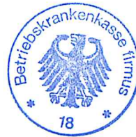
Siegel der BKK firmus